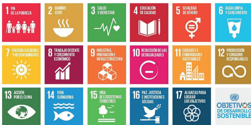
Figura 1. Objetivos de desarrollo sostenible, UNESCO (2017).

En sintonía con la UNESCO, para alcanzar estos objetivos es necesario contar con una educación holística, integradora y transformadora que considere: a) contenidos y los resultados de aprendizaje; b) la pedagogía y entornos de aprendizaje; c) frutos del aprendizaje; y d) transformación social. En definitiva, se trata de un desafío que requiere una evolución de la enseñanza al aprendizaje para educar a las actuales y futuras generaciones en sostenibilidad, con el propósito de “desarrollar competencias que permitan a las personas reflexionar sobre sus propias acciones, teniendo en cuenta sus impactos sociales, culturales, económicos y ambientales actuales y futuros, desde una perspectiva local y global” (UNESCO, 2017, p. 7). De esta manera, se espera que a través de la EDS las generaciones actuales y futuras puedan alcanzar aprendizajes cognitivos, socioemocionales y conductuales específicos, y, sobre todo, desarrollar competencias clave de sostenibilidad, requeridas para contribuir a la comprensión y al logro de cada uno de los desafíos particulares de los ODS (Rieckmann, 2012). Esto trae consigo la necesidad de generar instancias de crecimiento profesional del profesorado que les permitan incorporar competencias clave de sostenibilidad (UNESCO, 2017) y