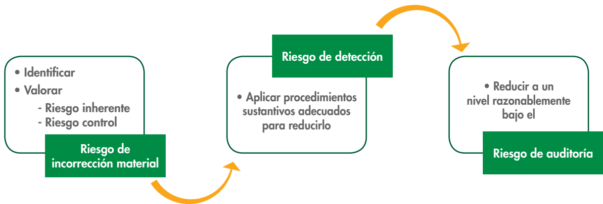
Figura 2: Estrategia general para reducir el riesgo de auditoría