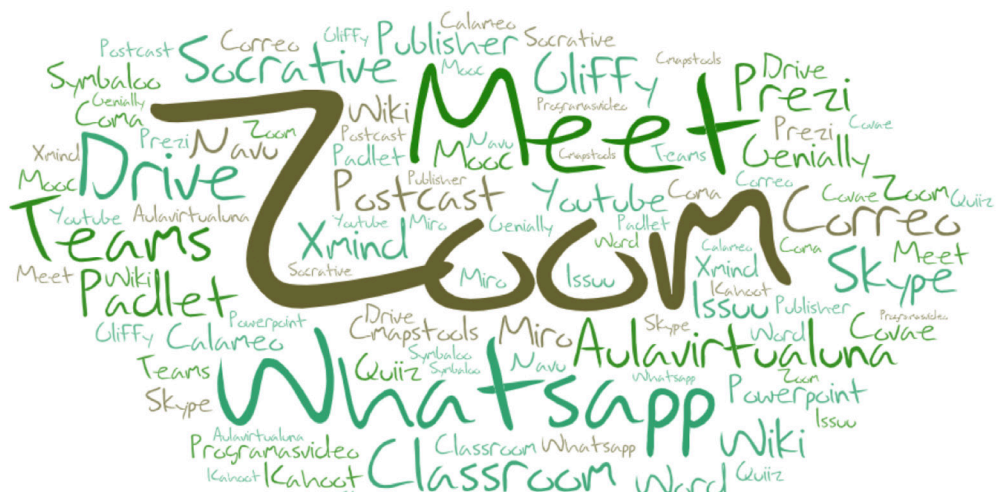
Figura 1. Aplicaciones digitales utilizadas por personal académico en los cursos de la DET en la presencialidad remota durante el primer y segundo ciclo.

Por otro lado, como complemento a lo propuesto por Jiménez y Robles (2016) cuando señalan que la estrategia didáctica también incluye el medio para su implementación, se consultó en el cuestionario del personal académico las aplicaciones digitales utilizadas para implementar las estrategias, las cuales se indican en la figura 1.