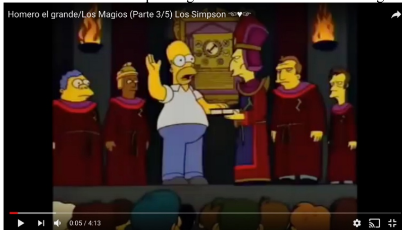
Imagen 5 Juramento de Homero para ingresar a la fraternidad de los magios