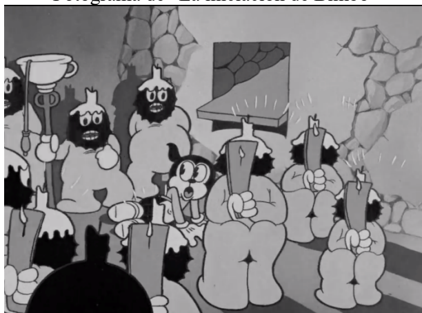
Imagen 3 Fotograma de “La iniciación de Bimbo”