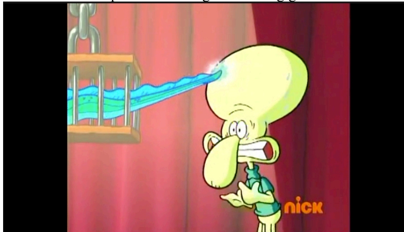
Imagen 7 La prueba de la anguila albina gigante