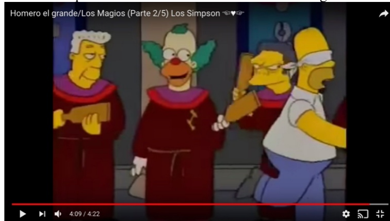
Imagen 4 La prueba de “cruzando el desierto” de los magios