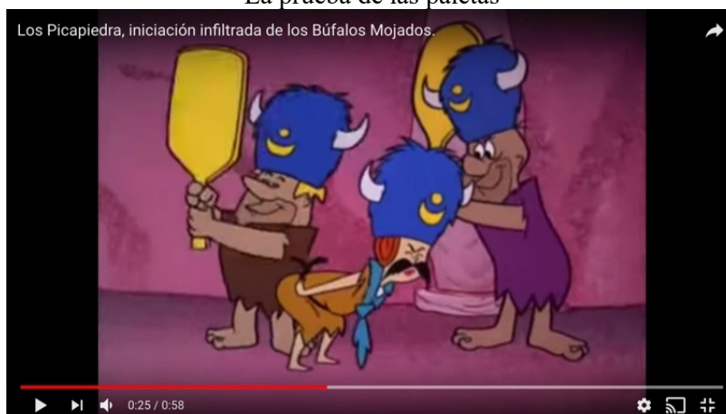
Imagen 6 La prueba de las paletas