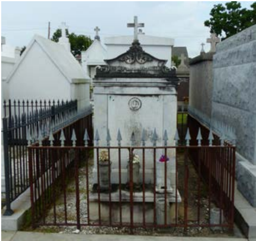
FOTOGRAFÍA DEL PANTEÓN DE LA FAMILIA BRISOLARA-BARCELÓ. SAINT LOUIS CEMETERY NO. 3. NUEVA ORLEANS, EE.UU.