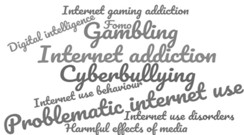
Figura 2: Nube de palabras clave

La revisión sistemática realizada ha permitido identificar una terminología variada (Figura 2) relacionada con el objeto de estudio. El término más utilizado corresponde a Internet Addiction , apareciendo en el 41,6% de los artículos, seguido de Problematic Internet Use en un 16,6% (Díaz-Aguado et al., 2018; Ke & Wong, 2018; Király et al., 2020; Yudes et al., 2020) y de Internet use behavior (Walther et al., 2014), en un 4,1%. A continuación, se han identificado términos más específicos como Cyberbullying (del Rey et al., 2016; Hinduja & Patchin, 2017; Lancaster, 2018) y Gambling (Thomas et al., 2018; Walther et al., 2013), la terminología principal en un 16,6% y en un 8,3% es de los trabajos respectivamente, o Internet Gaming Addiction (Wang et al., 2014) en un 4,1%.