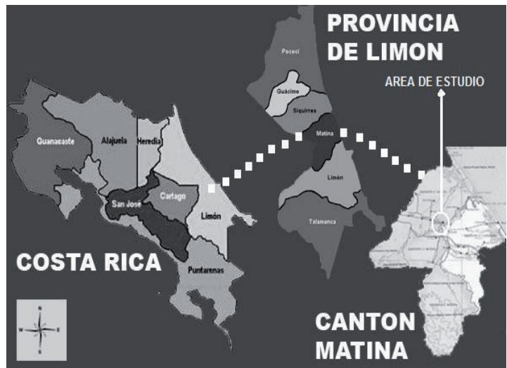
Figura 1. Ubicación del área de estudio de la investigación

características del suelo, la morfología del relieve y las condiciones climáticas hacen que se presenten inundaciones regularmente. Aunado a que aumente el riesgo a inundaciones se debe considerar que en el lugar tiene un bajo desarrollo económico, ver figura 1.