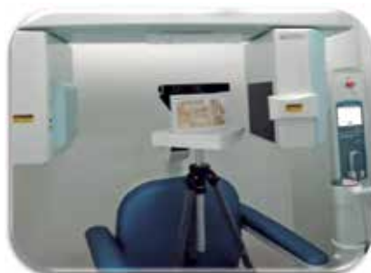
Fig. 4 Equipo tomográfico, junto con el posicionador y lámina de piezas dentales por evaluar