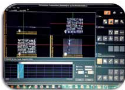
Figura 3. Imagen de la tomografía, donde se observan los diferentes planos.

te especialmente confeccionado para la prueba, que tiene un tamaño de 15mm de alto por 11mm de ancho. Estas piezas se fijaron con silicón caliente de manera vertical, (Fig. 6)