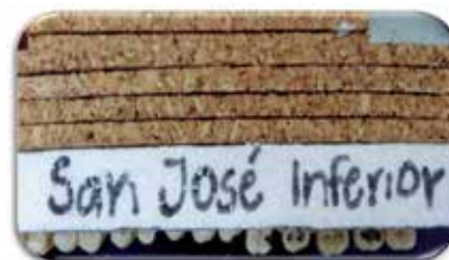
Fig. 7 Piezas montadas en espuma compacta de estereofón y láminas de corcho en la parte posterior.

La lámina de soporte tiene 10 capas de corcho de 1 pulgada de espesor para darle estabilidad y soporte, y para evitar que se sobreponga la cabecera del equipo en la tomografía. Luego se pegó sobre una base de estereofón con silicón y de esta