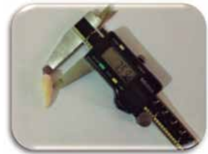
Fig. 2. Medición de la longitud coronal utilizando un pie de rey de marca Mitutoyu serie 500, con un margen de error de 0,01 mm (fig. 6).

Se realizó un análisis clínico, por medio de un pie de rey, que es un instrumento electrónico para calibrar, que determina la longitud coronal de los dientes permanentes según su clasificación anatómica en la población costarricense. Figura 2