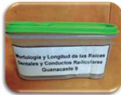
Fig. 1. Recipientes para recolección de las piezas dentales

de las clínicas privadas y públicas: Hospitales y EBAIS (Equipo básico de atención integral en salud) de la Caja Costarricense del Seguro Social. En cada lugar de trabajo se asignaron recipientes identificados con diferentes colores para su codificación. Figura 1