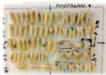
Fig. 6 Piezas montadas en espuma compacta polietileno ( estereofón), reforzada con láminas de corcho como soporte

te especialmente confeccionado para la prueba, que tiene un tamaño de 15mm de alto por 11mm de ancho. Estas piezas se fijaron con silicón caliente de manera vertical, (Fig. 6)