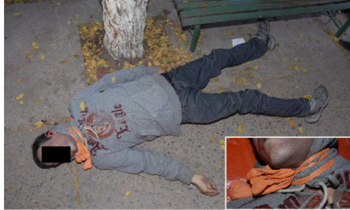
Figura 1. Cadáver en decúbito supino sobre el suelo de cemento, destacando un lazo cervical anudado alrededor del cuello y sobre la sudadera. Se observa una pequeña banqueta y el tronco de un árbol aledaño al cuerpo.