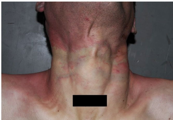
Figura 2: Examen externo del cuello. Zona cervical anterior donde se aprecia un surco equimótico-excoriatiivo, ancho e irregular, con marcada congestión de la piel sobre el límite superior del surco.

En el examen externo se encontró marcada congestión facial, petequias en las conjuntivas, párpados, regiones mastoideas y en el rostro. Había escurrimiento sanguinolento desde el conducto auditivo externo derecho. La lengua estaba dentro de la boca, no presentaba mordeduras.