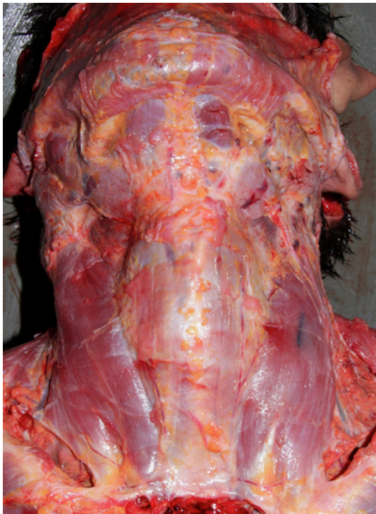
Figura 3: Disecção cervical

Al examen interno, la disección cervical reveló que la musculatura antero lateral cervical, el esqueleto laringo-hioideo y la glándula tiroides estaban indemnes (Figura 3). Solamente la lengua presentaba abundante hemorragia desde la punta hacia la base, al igual que los músculos del suelo de la boca (Figura 4).