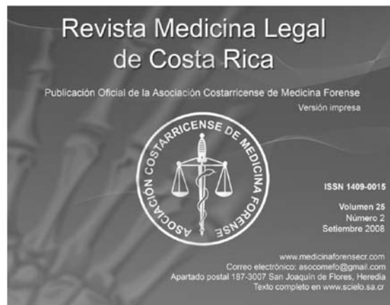
Figura 4: Revista Medicina Legal de Costa Rica 2008