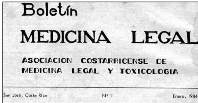
Figura 1: Título del primer Boletín de Medicina Legal, precursor de la actual Revista