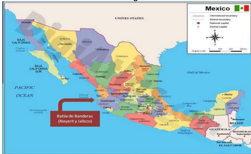
Figura 1. México. Bahía de Banderas localizada entre los Estados de Nayarit y Jalisco.