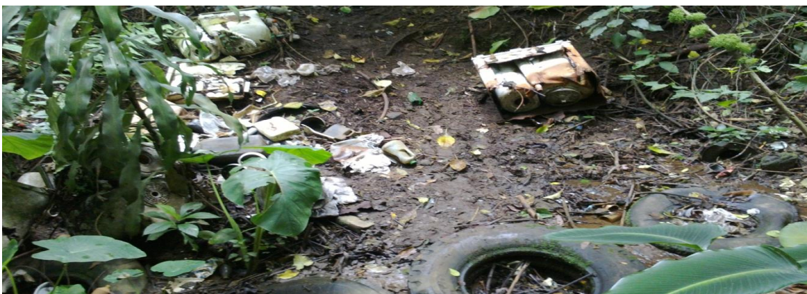
Figura 3: Desechos sólidos en el naciente de una ASADA que abastece una comunidad de más de 2000 personas en el cantón de Grecia

Los problemas con desechos sólidos son también un tema de discordia para los entes administradores, cuando en realidad se trata de un problema de salud pública que debe ser atendido con prontitud, ya sea ASADA o Municipio quien administre, no se puede permitir ese tipo de accionar en las nacientes, debido al riesgo de contaminación que representan. (ver figura 3)