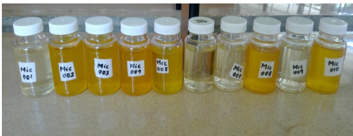
Figura 1: Análisis bacteriológico de la red de agua potable de una ASADA

Fuente: El autor. Laboratorios del Recinto de Grecia de la UCR, julio de 2012.