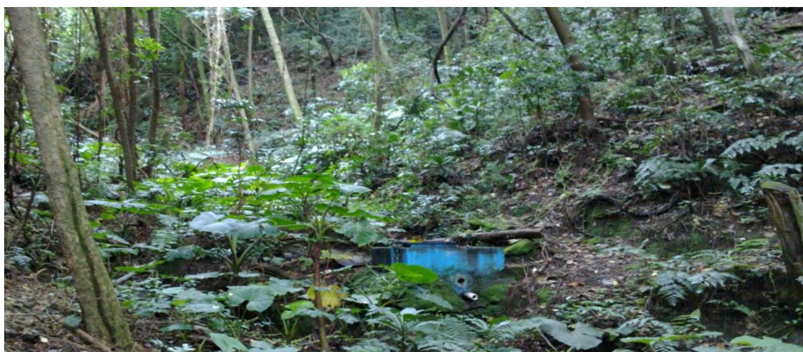
Figura 2: Vulnerabilidad del naciente de una ASADA que abastece una comunidad de más de 2000 personas en el cantón de Grecia

En la zona de Grecia son realmente pocas las ASADAS que ofrecen este tipo de resguardo a los nacientes, algunas solamente están captadas, lo que representa un riesgo de salud pública, dado que cualquier persona podría generar en una comunidad daños irreparables, al agregar sustancias tóxicas a la red de distribución, que llega a casas, escuelas, hospitales, comercios entre otros; es decir, actualmente no se limitan las acciones “terroristas” o acciones encaminadas a perjudicar la salud de los abonados (ver figura 2).