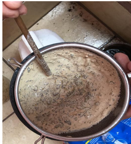
Fotografía N° 2 Proceso de colado de la savia del árbol de hule