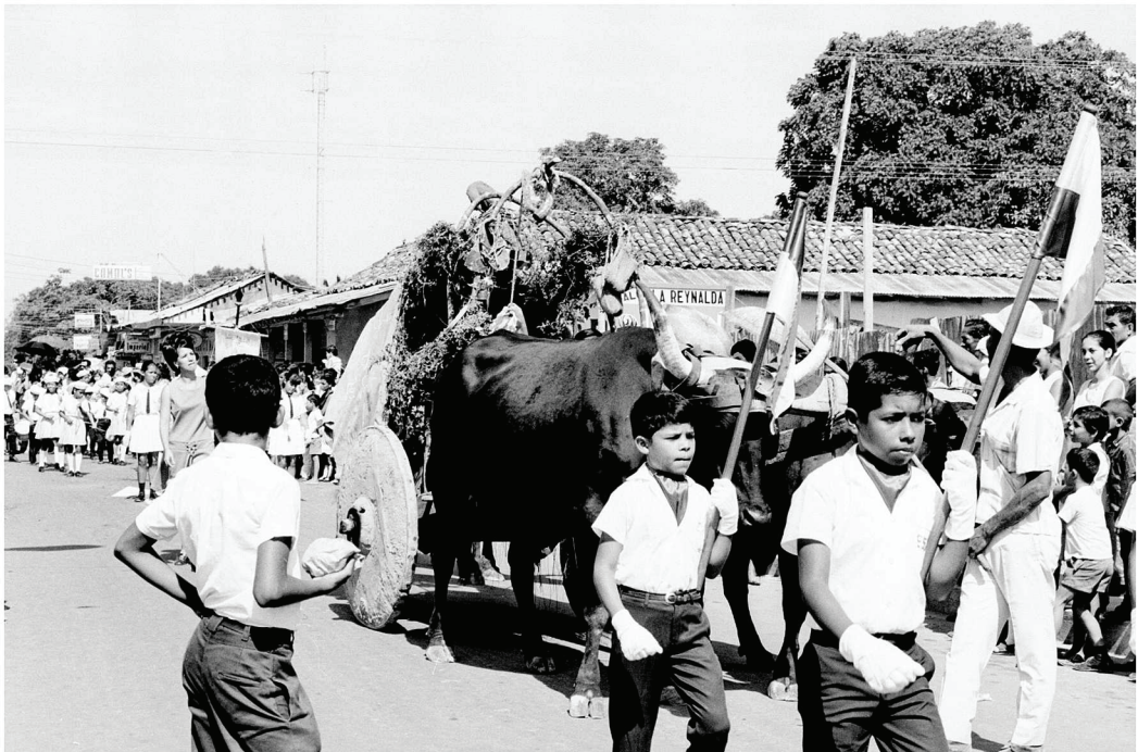
Figura 2: Gira del Ministerio de Obras Públicas y Transportes (MOPT) a Guanacaste en 1971. Desfile de la celebración de la anexión en las calles de Nicoya.

En cuanto a las actividades especiales en la provincia, sobresale la exposición ganadera que se posicionó en Liberia. La primera edición fue en 1955 y en lo posterior fue acaparando paulatinamente la atención de la celebración liberiana. Las mismas actividades que se realizaban en los desfiles y actos cívicos, así como en algunas de las actividades especiales mencionadas, se reproducían en las exposiciones. Incluso en otras partes de la provincia como Nicoya, la ganadería se hacía presente en el paisaje festivo con la incorporación de animales en los desfiles, como se aprecia en la Figura 2 . Tal fue el grado de relevancia que adquirieron las exposiciones, que las mayores autoridades políticas nacionales empezaron a concurrirlas; como los Presidentes de la República y Ministros de Agricultura. Ello constituía