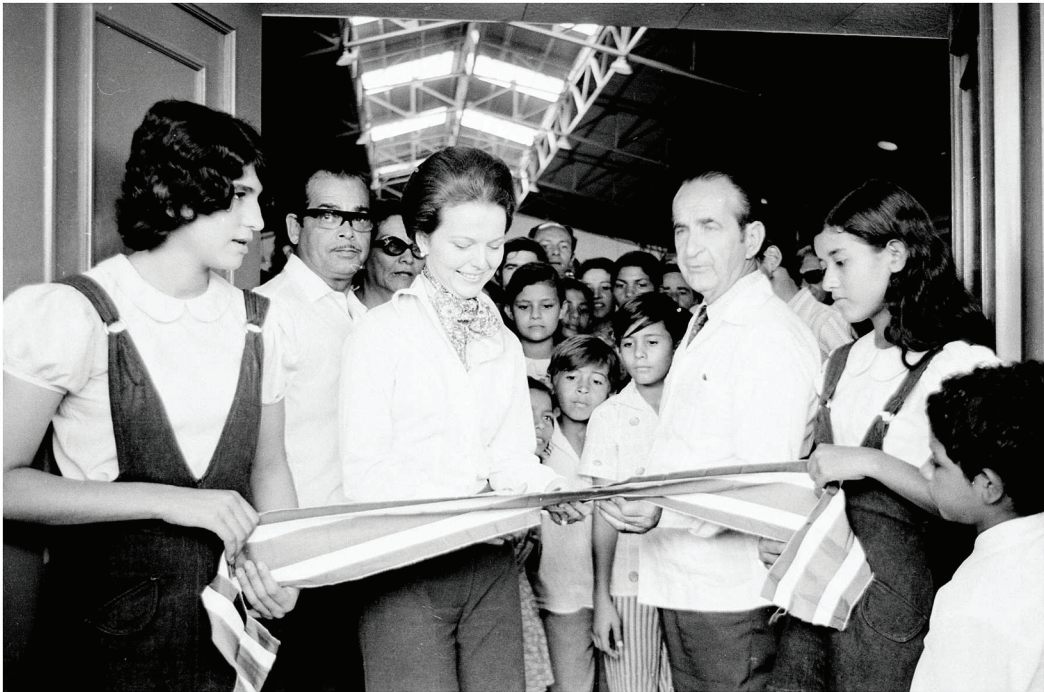
Figura 1: Inauguración del Gimnasio Leonidas Briceño en el Liceo de Nicoya. Administración Figueres Ferrer, 1970-1974.

cenicienta de Costa Rica, pero que ya no sucedía más así, gracias al desarrollo que había alcanzado (Diario de Costa Rica, 1971). En la misma línea, en 1974 se reconocía en el periódico La Nación que la región había pasado los primeros 125 años de anexión sin una integración real a Costa Rica, pero que en el 150 aniversario, que se conmemoraba ese año, esto era cosa del pasado, porque la apertura de la Carretera Interamericana había permitido introducir en la provincia el desarrollo de vías de comunicación, centros educativos, industria y turismo ( La Nación , 1974, p. 2).