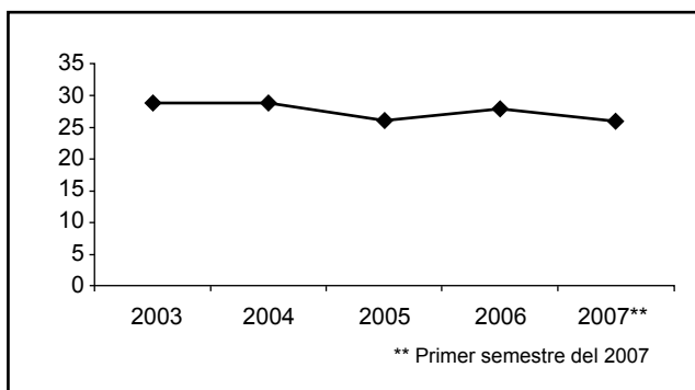
Gráfico 1: Traqueostomías realizadas, HNN, enero 2003 – primer semestre 2007