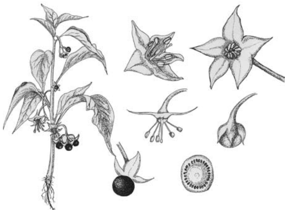
Figura 1. Dibujo de las partes constituyentes de una planta de Jaltomata procumbens (Cav.) J. L. Gentry forma erguida, recolectada en San Lorenzo Tlacotepec, municipio de Atlacomulco, Estado de México, México, 2006.

Jaltomata procumbens es una planta arbustiva (Figura 1) con tallo succulento de color verde; hojas simples con borde liso; flores de color verde blanquecino o amarillo pálido; el fruto es una baya de color negro con semillas pequeñas (Centurión et al. 2000; Davis y Bye 1982). Se distribuye por la República Mexicana sobre todo en climas templados y húmedos (Tovar 2005).