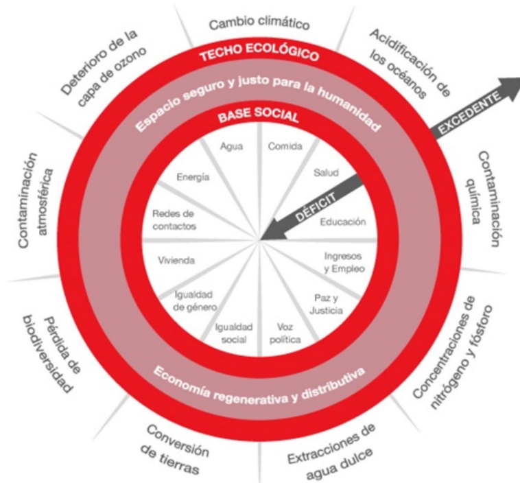
Figura 2. Dona de Raworth (2018b, p. 54) adaptada por Kayser (2020).

la economía de la dona. La dona “es una brújula radicalmente nueva para guiar a la humanidad en este siglo. Y apunta a un futuro que puede satisfacer las necesidades de cada persona al tiempo que salvaguarda el medio natural del que todos 2 dependemos” (Raworth, 2018b, p. 53). La Figura 2 especifica cuáles son los elementos que construyen esa dona.